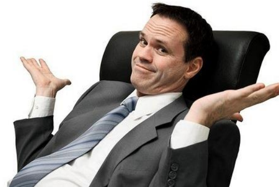
Chief Executive Officer (CEO)

Мониторинги Аудиты и аналитические записки Коллективные презентации